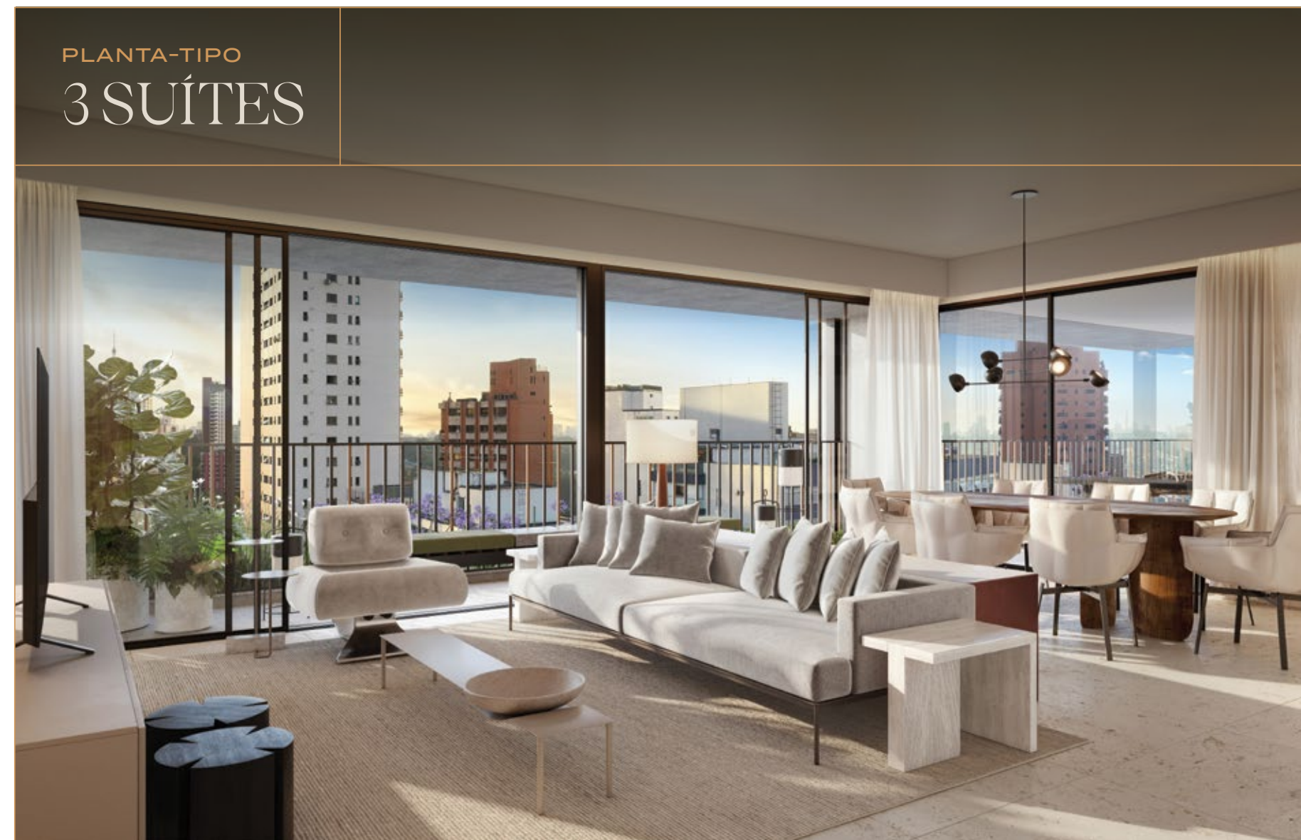
PERSPECTIVA ARTÍSTICA DO APTO. DE 3 SUÍTES DE 207,40 M 2 - 1 POR ANDAR*