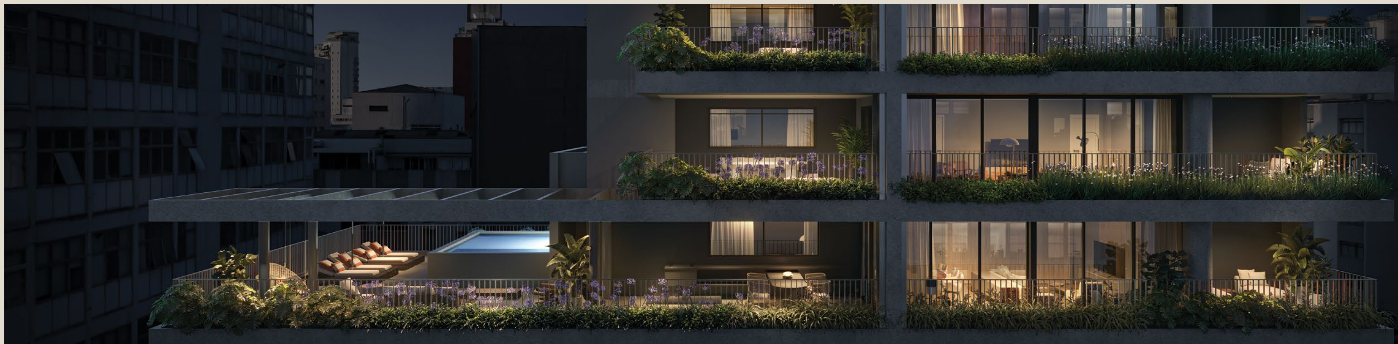
PERSPECTIVA ARTÍSTICA DO DETALHE DA PENTHOUSE*