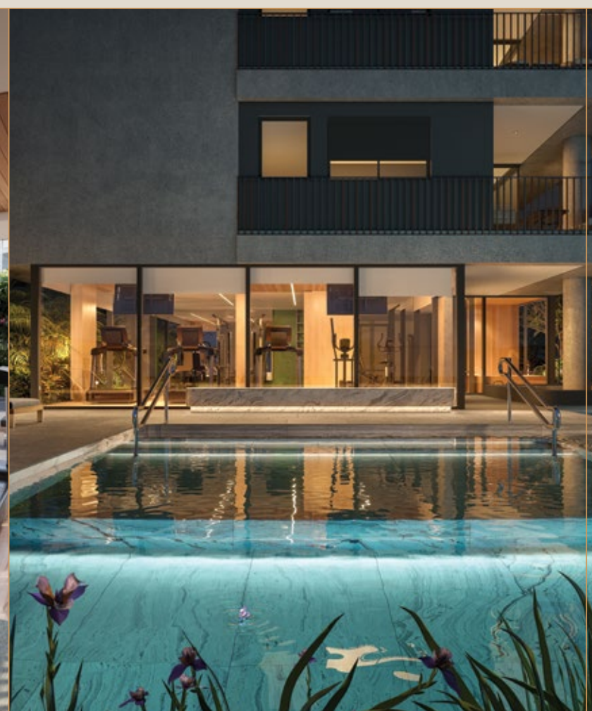
PERSPECTIVA ARTÍSTICA DA PISCINA UAPÉ RESIDÊNCIAS*