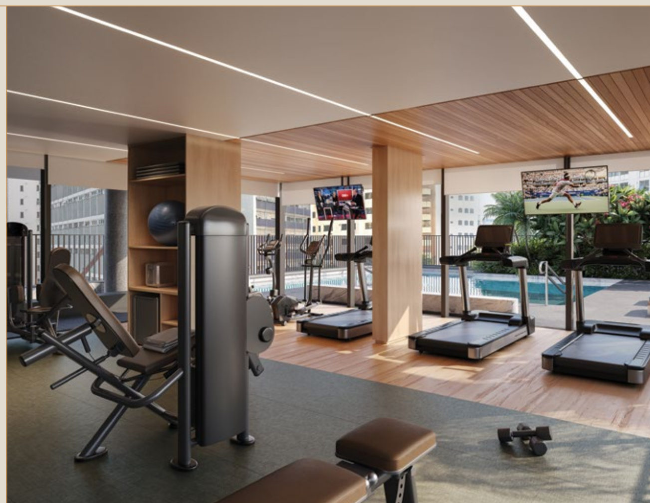
PERSPECTIVA ARTÍSTICA DA ACADEMIA – UAPÉ RESIDÊNCIAS*