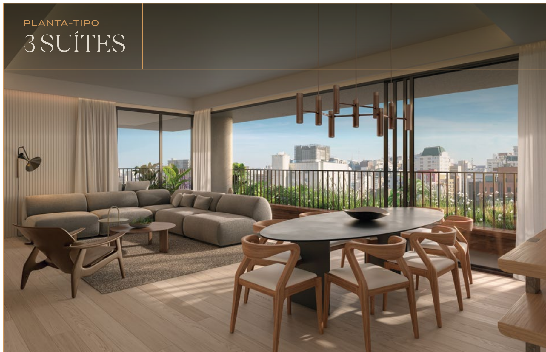
PERSPECTIVA ARTÍSTICA DO APTO. DE 3 SUÍTES DE 167,93 M 2 - 2 POR ANDAR*